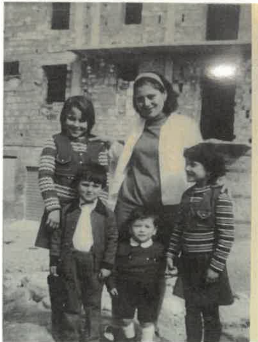
La Mamma e Bambini