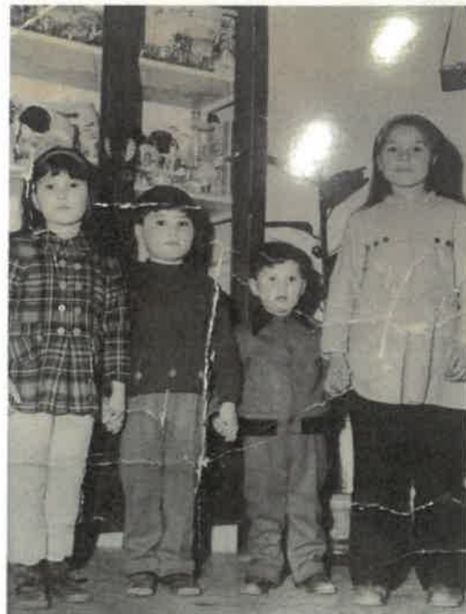
Grande Sorelle e piccolo Fratello